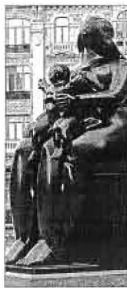
La Maternidad de Botero, imagen del encuentro.

Todos estos aspectos "se tendrán en cuenta sin olvidar los temas clásicos de los congresos nacional de Semergen: la formación continuada centrada en el DPC-AP, los talleres de habilidades y los foros de carácter profesional", según recalca el coordinador del próximo encuentro.